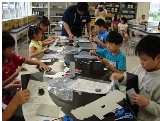
ピンホールカメラ製作の様子。