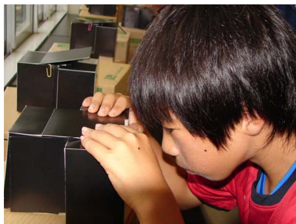
いよいよ撮影、うまく写るかな！