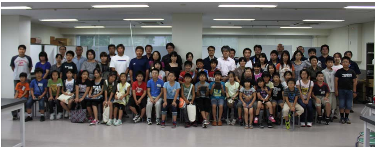
理科工作教室終了後，全員で記念撮影。