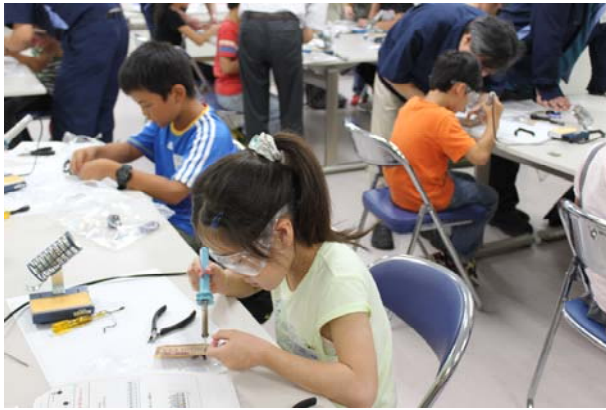
はんだ付けが難しいかな。