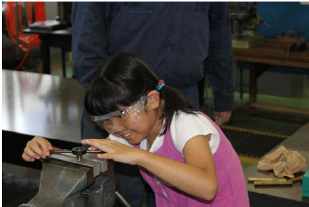
ダイスを使ってねじをきります。