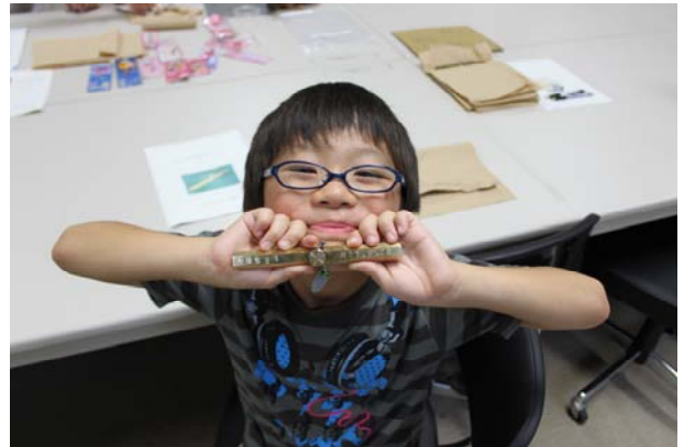
ぴっかぴかの完成品です。