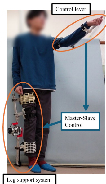
装着型脚支援システム MagniLeg

そこで、下肢麻痺がある脚に装着する、モータで駆動する装置を製作しています。装置中に磁力を活用したギアを内蔵し、軽量化を図っています。